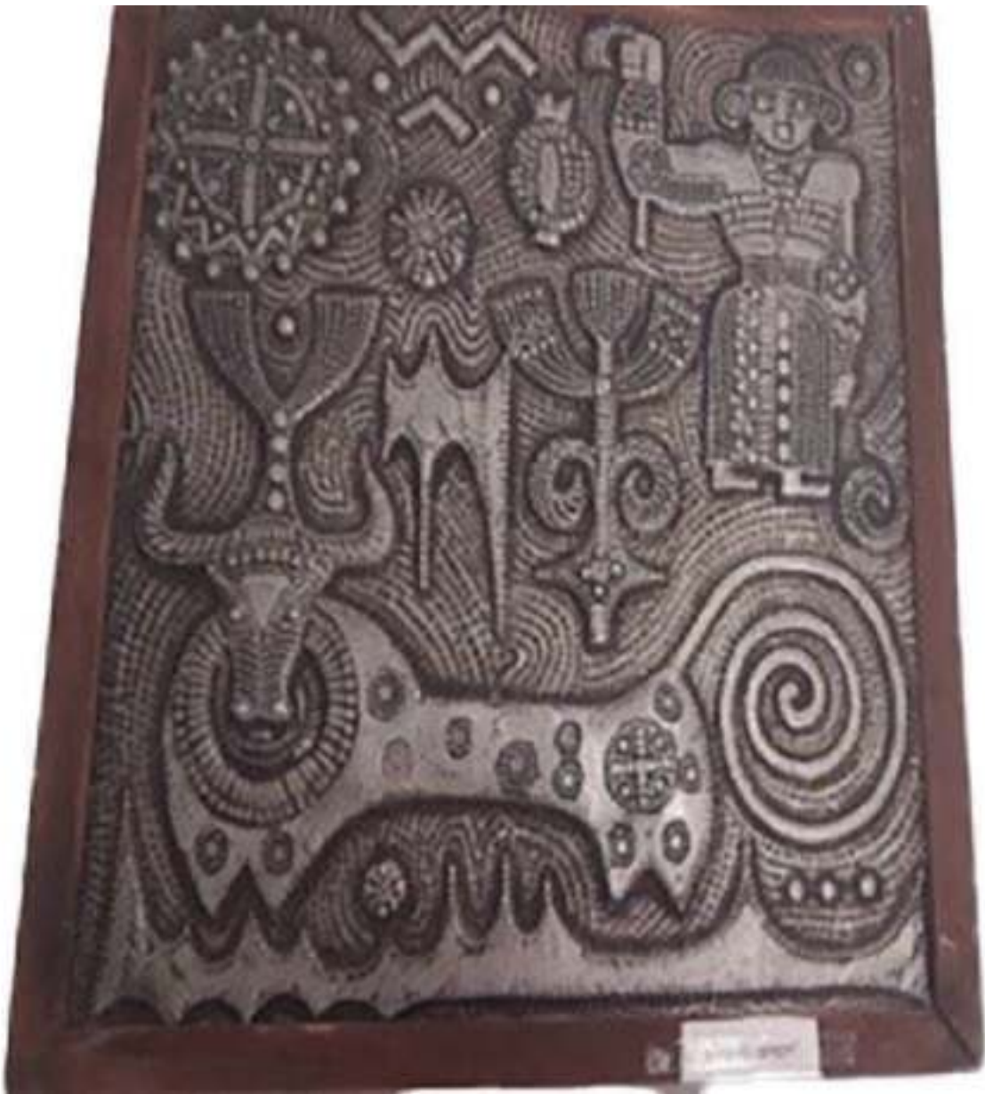
ილ. 6 ანთიმოზ გორგაძე. ლაშარის ხარი (გამ. 720)