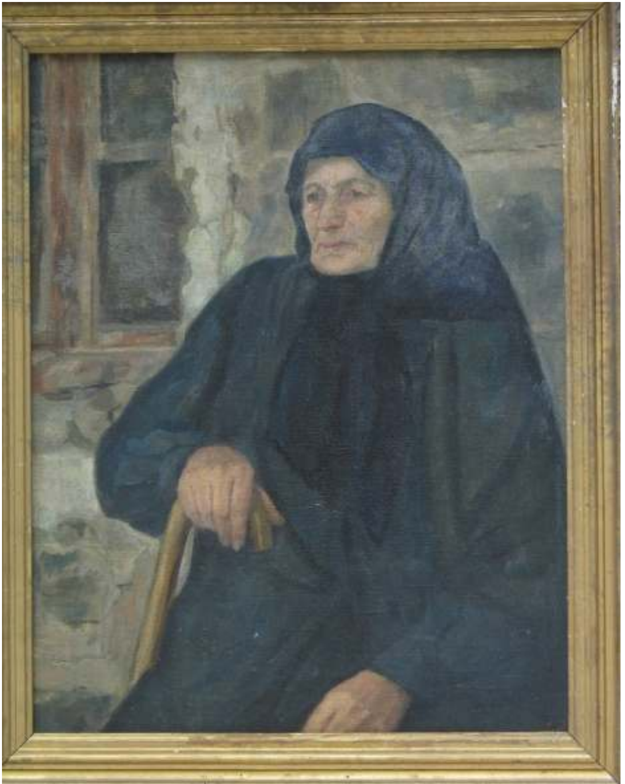
ილ. 7 ქეთევან მაღალაშვილი. ვაჟა-ფშაველას მეუღლის პორტრეტი (ფ-449)