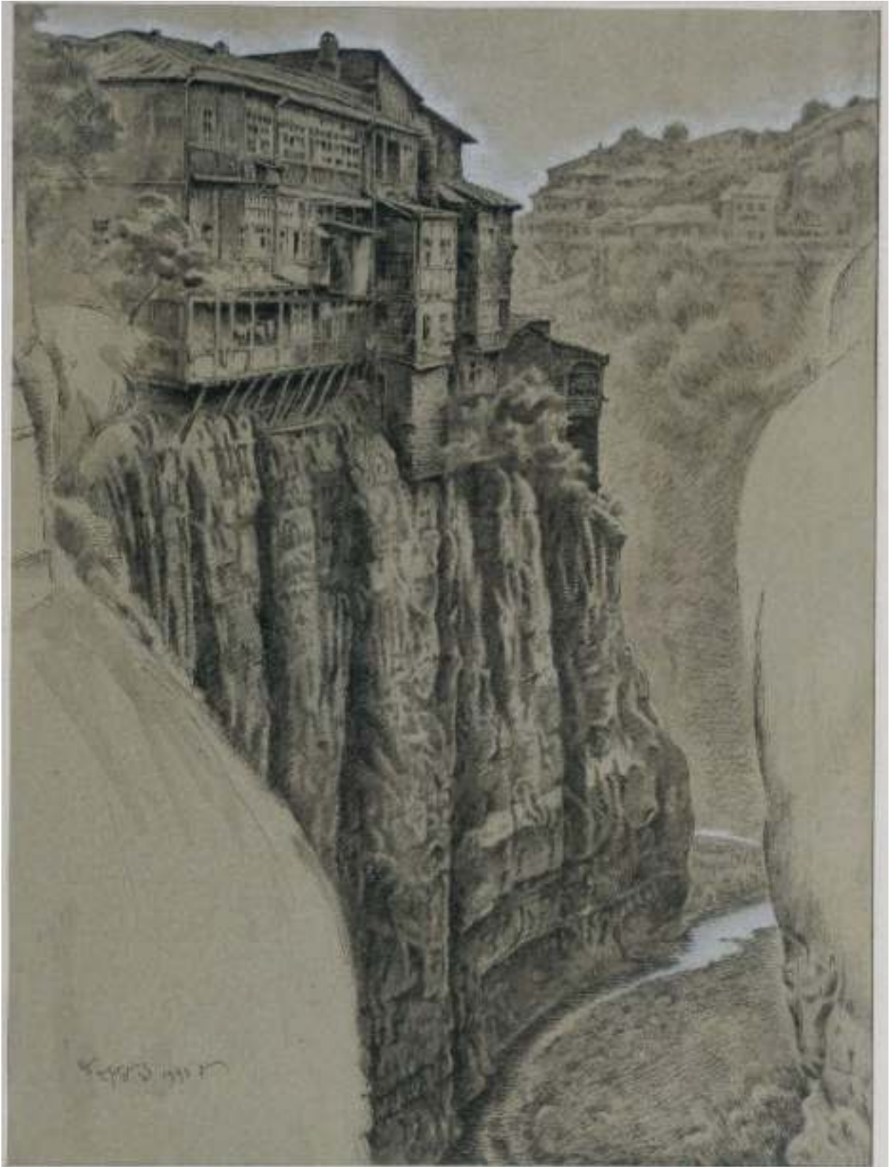
ილ. 9 ზურაბ ლეჟავა. ბოტანიკურ ბაღში (გ-485)