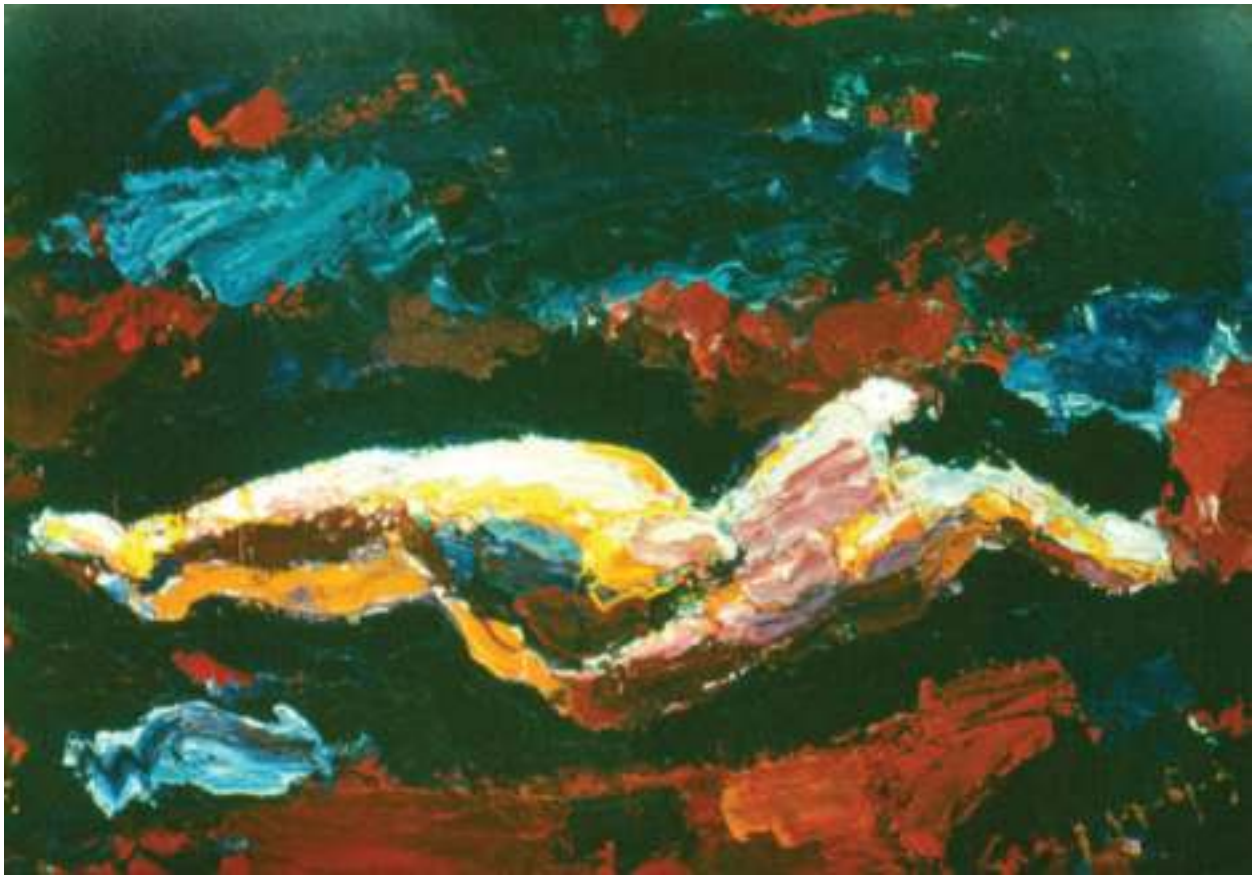
ილ. 4 ედმუნდ კალანდაძე. შიშველი ქალი (ფ-1801)