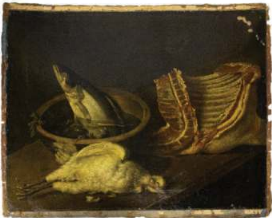
ილ. 2 ჟან შარდენი. ნატურმორტი. XVII ს. (ხმ. დე/ფ-275)