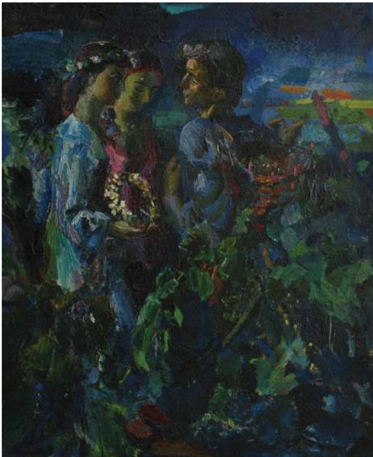
ილ. 8 ავთანდილ პოპიაშვილი. ჩემი კახეთი (ფ-866)