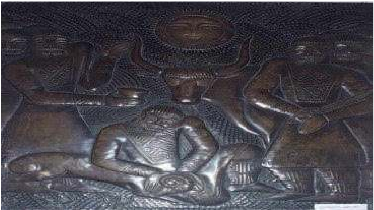
ილ. 5 გურამ გაბაშვილი. დლეობა (გამ. 1336)