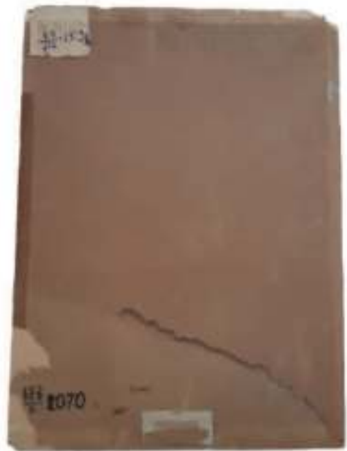
უკანა მხარე რესტავრაციამდე