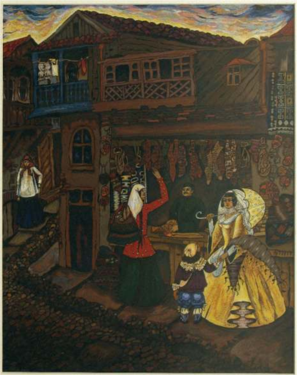
ილ. 10 ჯულიეტა ბერძენიშვილი. ძველი თბილისის მოტივები. ძველი სახლი (გ-1482)