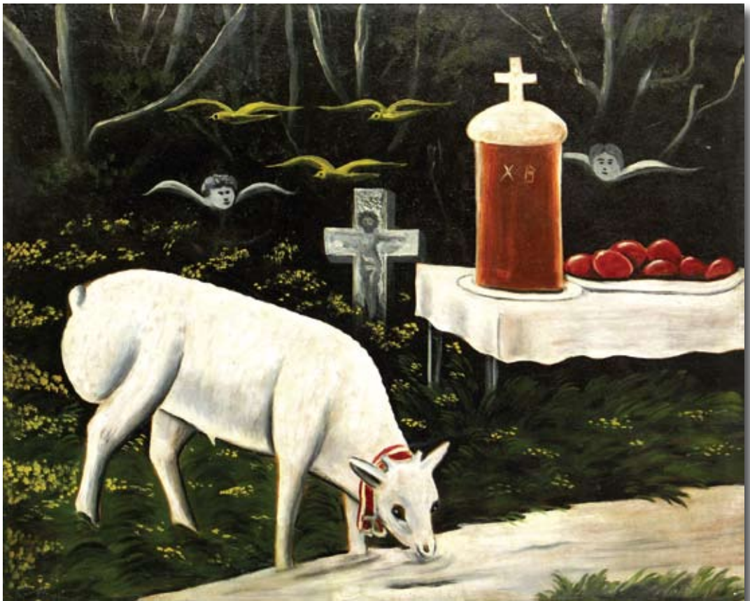
საალდგომო ბატკანი 1914-15, მუშაობა, ზეთი. 80x100 სმ

Niko Pirozmanashvili (1862-1918) was born to a peasant family in one of the regions of Georgia – Kakheti, in the village of Mirzaani. Orphaned at an early age Nikala was adopted by the rich family of Kalantarovs living in Kakheti. Soon Kalantarovs moved to Tbilisi where Pirosmani spent the rest of his life. He had never received a professional education. Art was the goal of his whole being, his life's vocation. For mere subsistence, he occasionally worked in Tbilisi "dukhangs" (tavern), or at the rail station.