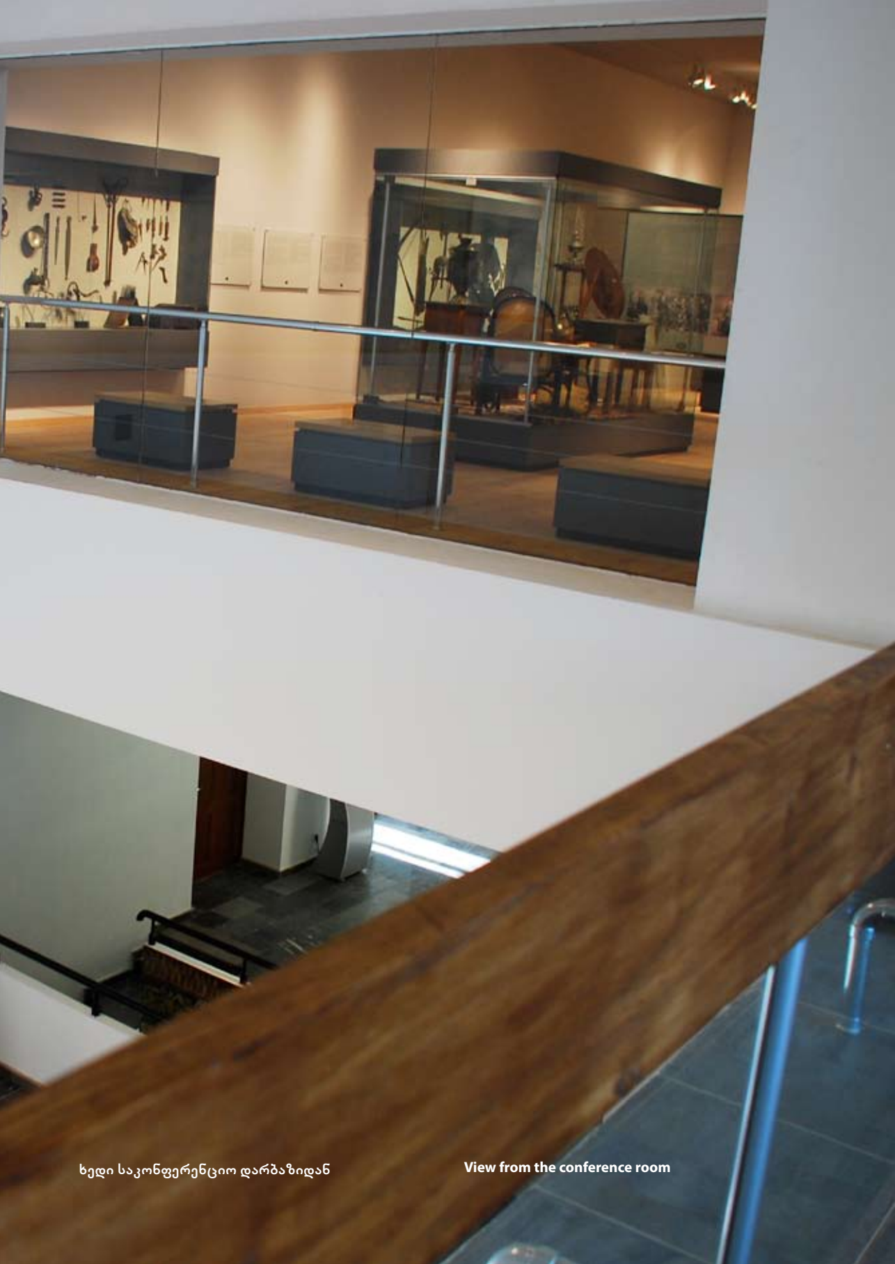
ხედი საკონფერენციო დარბაზიდან