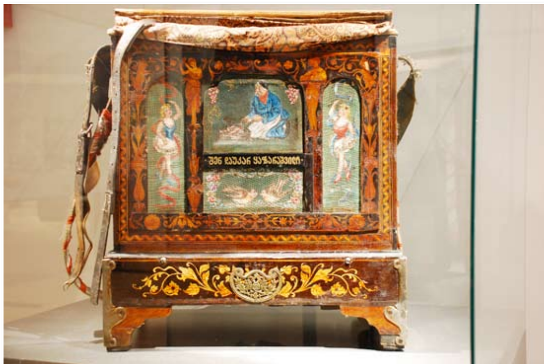
არღანი XIX ს-ის დასასრული